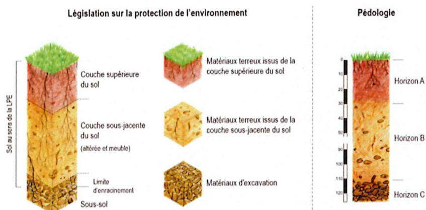
Figure 2 : Définitions du sol