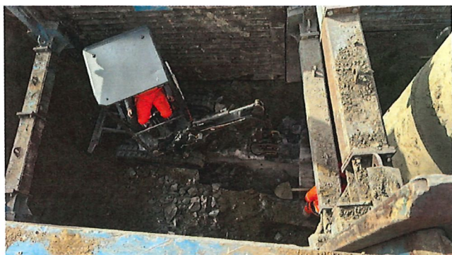
Photo 1 – Epaisseur de l'enrobage non homogène (par endroit double de l'estimation)