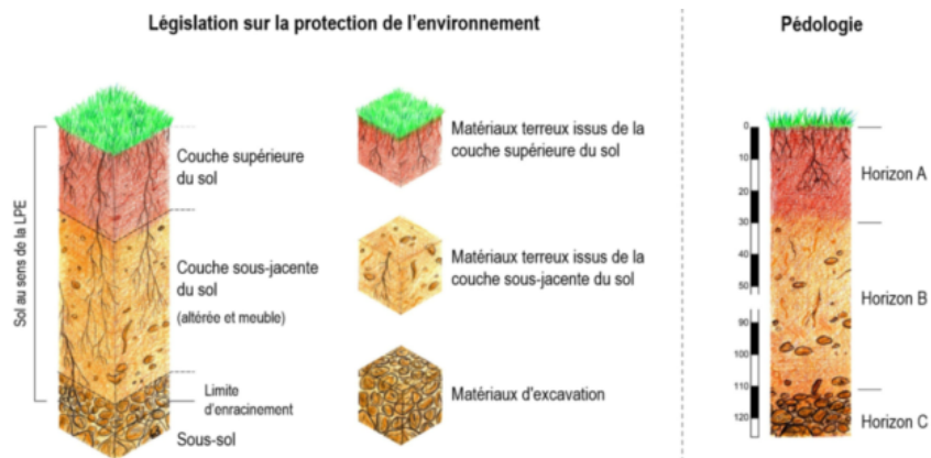
Figure 2 : Définitions du sol