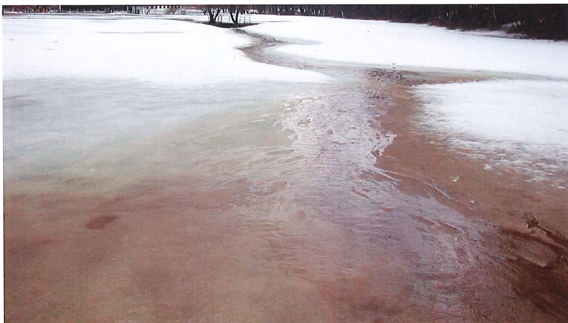
Figure 1 : Pollution visible liée à un épandage sur neige.