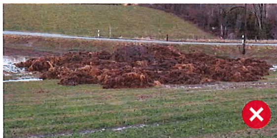
Entreposages non conformes de fumier en plein champ : générant une production importante de jus de fumier, à proximité d'une chambre d'eaux claires, sous la neige sans couverture, ou disposé en vrac.