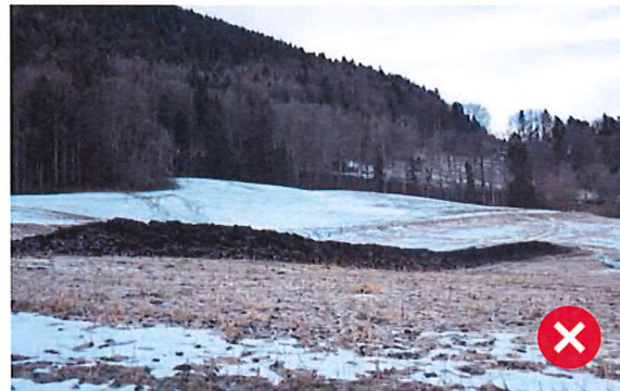
L'exemple de gauche ci-dessus montre un tas de fumier laissé en vrac et non préparé en andain; l'exemple de droite montre un andain non couvert en hiver.

L'exploitant est tenu de pouvoir fournir en tout temps et sur demande des autorités un plan indiquant les emplacements des andains de l'année en cours et des deux précédentes, ainsi que les parcelles concernées par l'épandage du compost mûr.