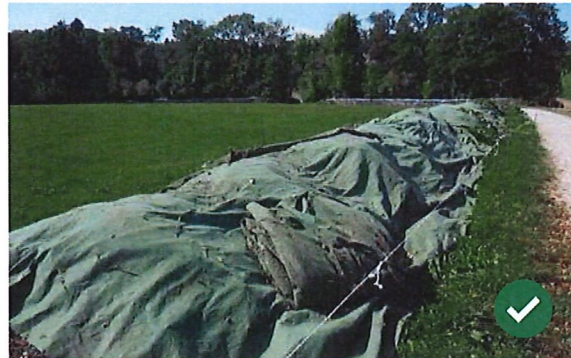
Les deux exemples ci-dessus illustrent des mises en andains conformes, à proximité du chemin d'accès.