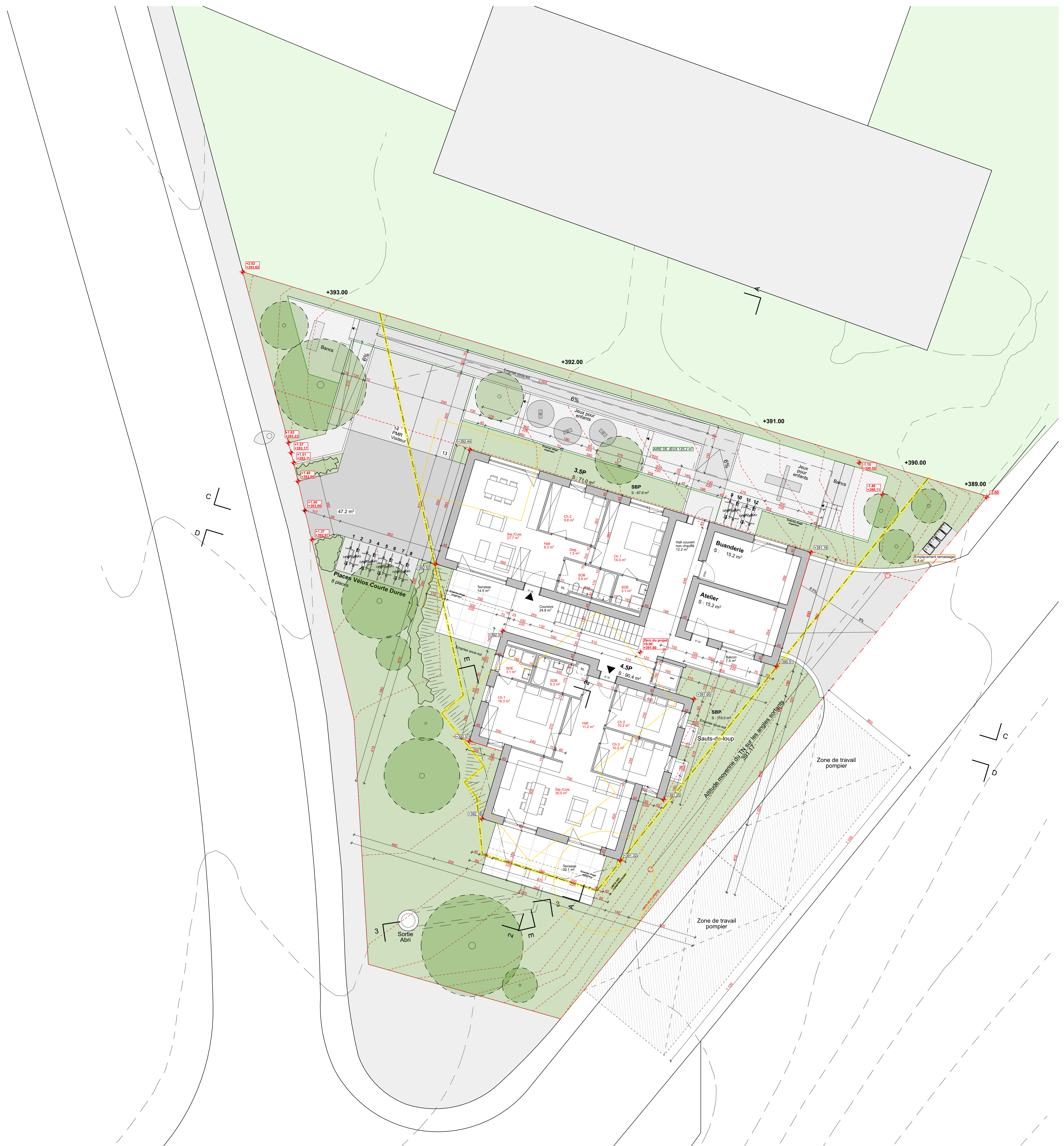
RDC + Am Extérieurs