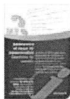
(flyer de présentation)

Ces lettres sont le fruit de notre collaboration avec la FSFP (Fédération Suisse pour la Formation des Parents) et de la FAPERT (Fédération des Associations de Parents d'Elèves de la Suisse Romande et du Tessin).